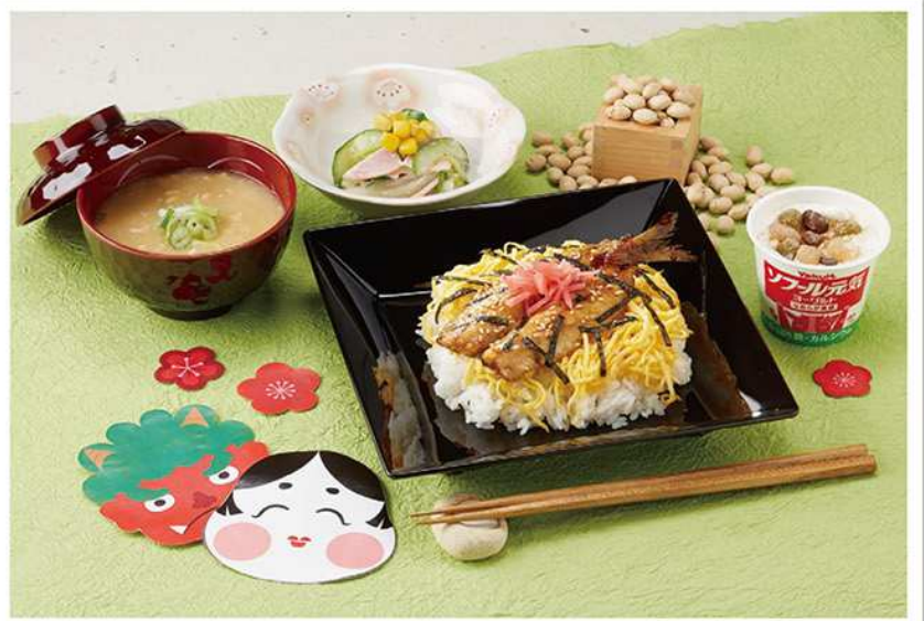
食器提供:スリーライン株式会社